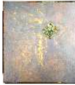
Aigle ailé 2.56x2.29m