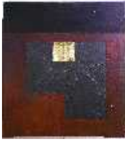
Cavalier noir 2.56x2.29m