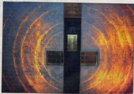
Encaustique et feuilles d'or pour ces deux icônes ("Le Dragon" et "l'Agneau") à rétro-éclairage éclairé.