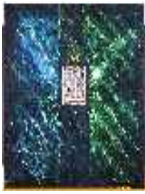
Homme ailé 2.56x2.29m