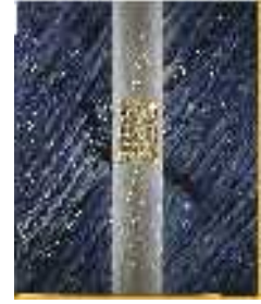
Cavalier vert 2.56x2.29m