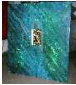
Homme ailé 2.56x2.29m